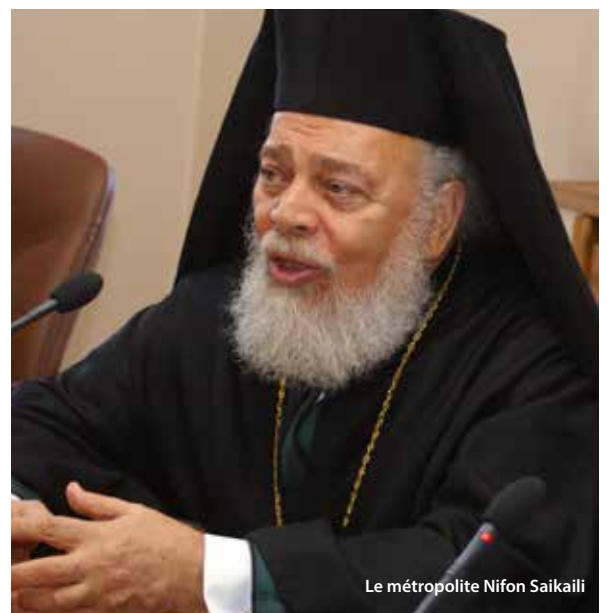
Le métropolite Nifon Saikaili