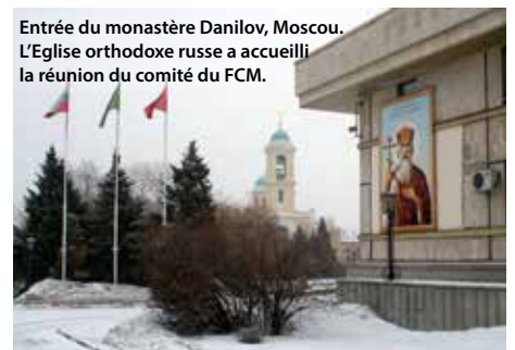
Entrée du monastère Danilov, Moscou. L'Eglise orthodoxe russe a accueilli la réunion du comité du FCM.