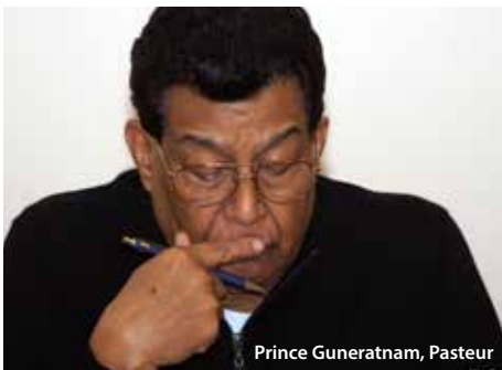
Prince Guneratnam, Pasteur