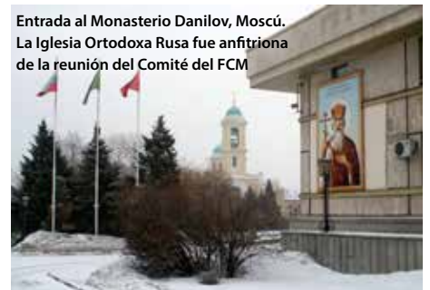
Entrada al Monasterio Danilov, Moscú. La Iglesia Ortodoxa Rusa fue anfitriona de la reunión del Comité del FCM