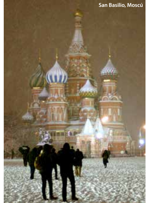
San Basilio, Moscú