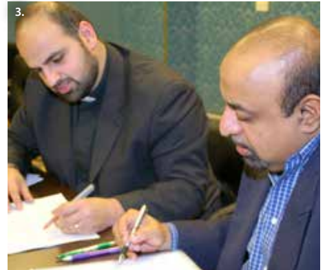
El Grupo Planificador de la Consulta DPM se reunió en el mes de marzo en la misma ciudad de Tirana. Allí se unieron a líderes de la iglesia de Albania y otros representantes mundiales para considerar la marcha y los detalles del encuentro. Arriba, de izq. a der.: