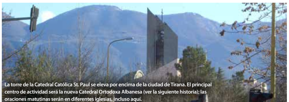
La torre de la Catedral Católica St. Paul se eleva por encima de la ciudad de Tirana. El principal centro de actividad será la nueva Catedral Ortodoxa Albanesa (ver la siguiente historia); las oraciones matutinas serán en diferentes iglesias, incluso aquí.