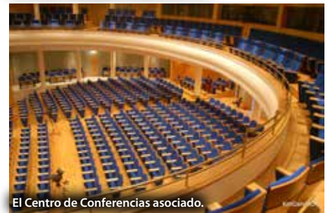
El Centro de Conferencias asociado.