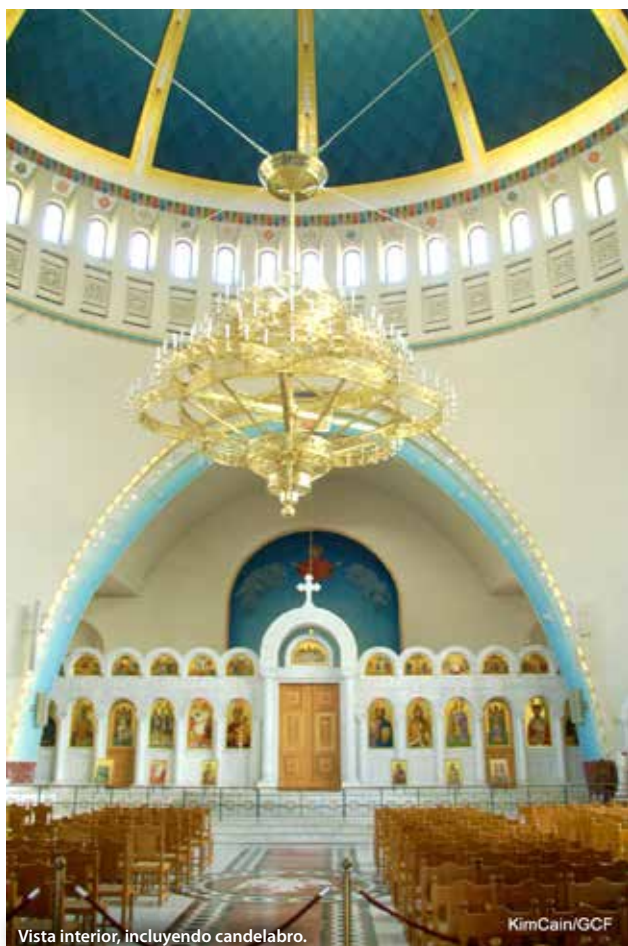
Vista interior, incluyendo candelabro.