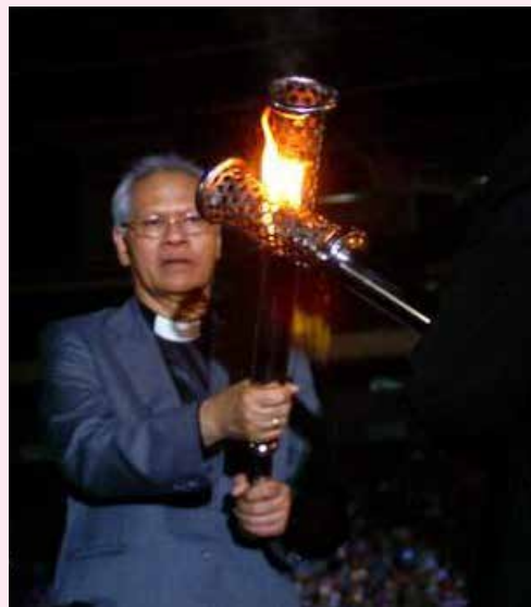
Despertando conciencia de unidad cristiana en Indonesia: En 2013 FUKRI realizó un encuentro en el estadio nacional de Yakarta. Aquí los líderes de la iglesia encendieron una llama de unidad durante las celebraciones.

La población cristiana indonesia es el ocho por ciento del total nacional de 253 millones de personas. Con un 87 por ciento adherido al Islam, Indonesia cuenta con la población más grande Musulmana en un solo país del mundo de hoy.