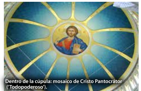
Dentro de la cúpula: mosaico de Cristo Pantocrátor ('Todopoderoso').