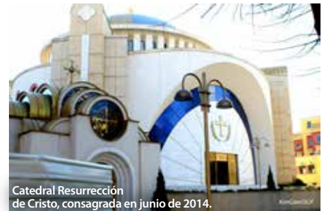
Catedral Resurrección de Cristo, consagrada en junio de 2014.

Irónicamente, tanto el hotel como la catedral serán usadas por los participantes durante la consulta sobre 'Discriminación, Persecución y Martirio.