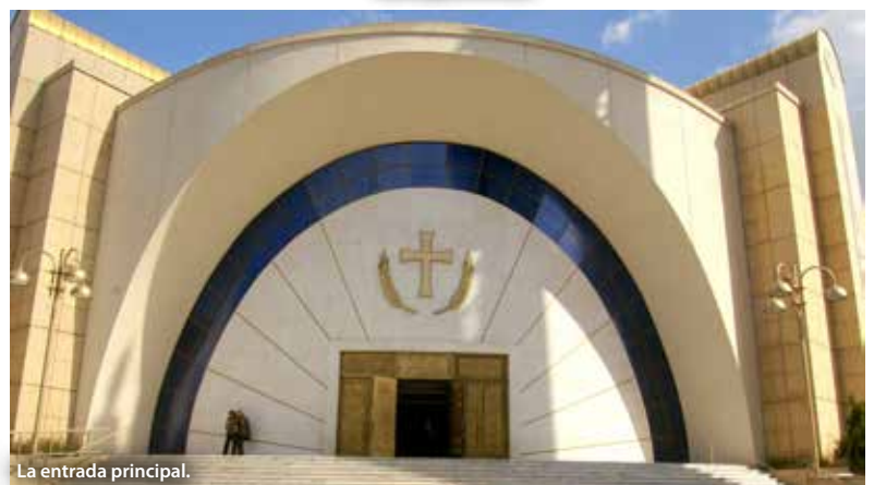
La entrada principal.